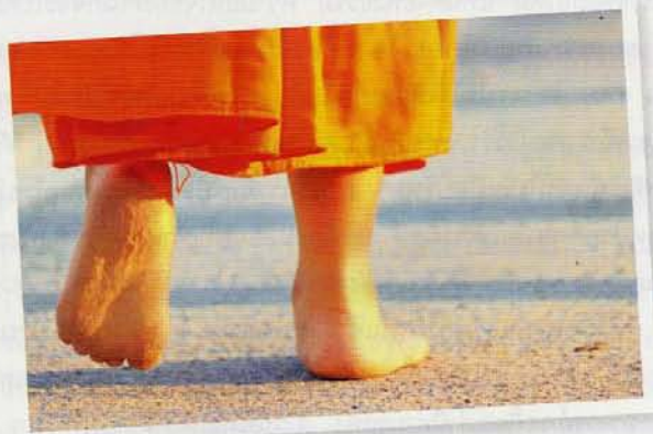
เดินบนหาดจนเท้าแดงก็ยังไม่ถอด

ผมก็ยังไม่รู้เลยนะครับว่าความทุกข์คืออะไร บางทีเมื่อมีประสบการณ์ชีวิตมากขึ้นหรือโตขึ้น มันน่าทำ ผมอาจจะบอกได้ (ถ้าอย่างนั้นอะไรที่จะทำทำให้ไม่สบายใจได้บ้าง) การอดกินข้าวมื้อกลางวันครับ ไม่ได้